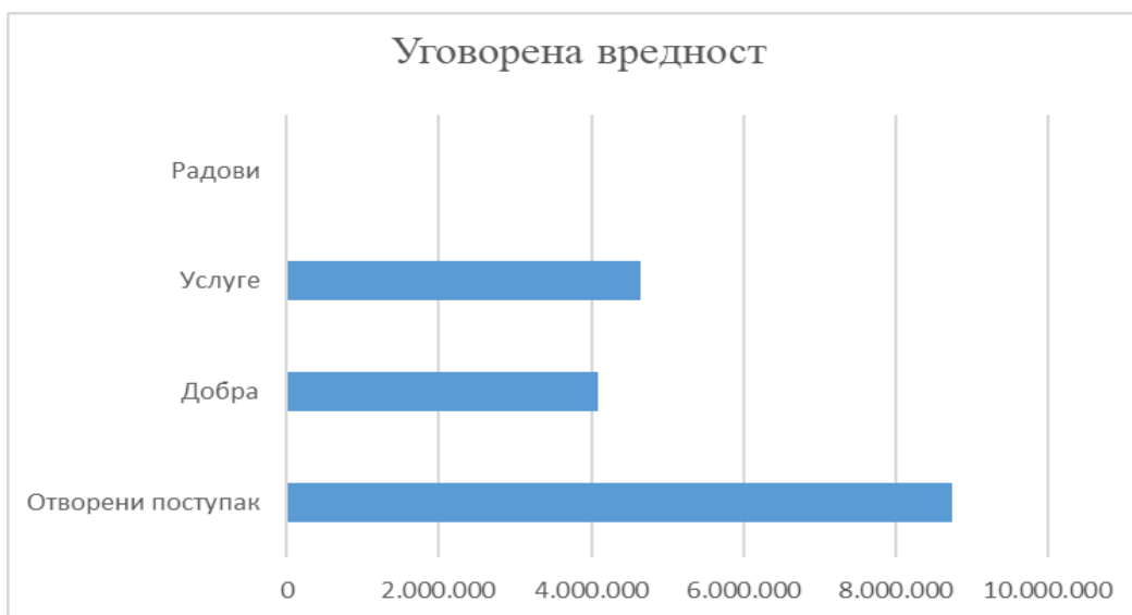
Табела број 8: Преглед спроведених поступака јавних набавки према предмету јавне набавке за 2022. годину